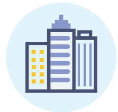
Tính có sẵn