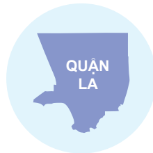
Khoảng cách gần gũi